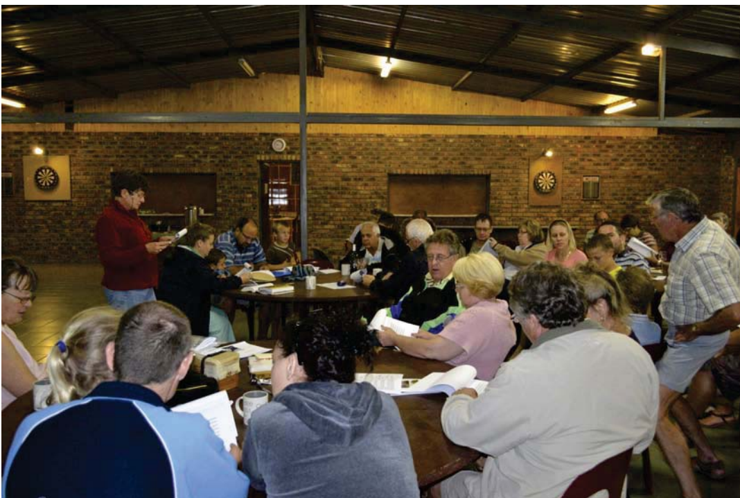
Die Sing-a-long by Bloekompoort