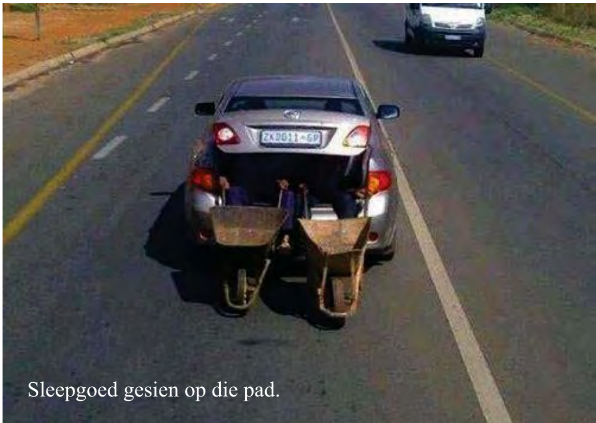
Sleepgoed gesien op die pad.