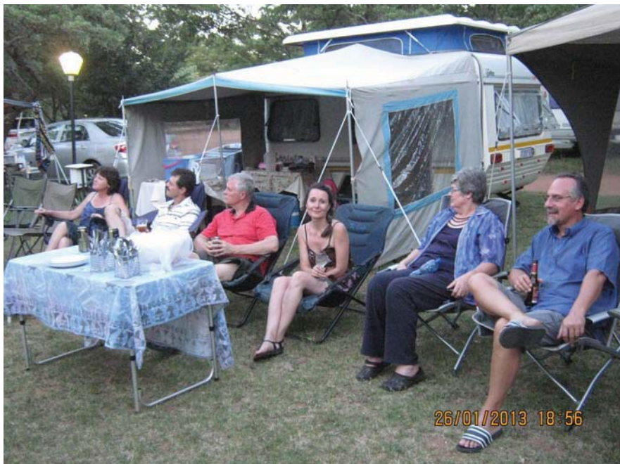
Die hele kamp het in 'n groot sirkel gesit en kuier tot die sjinese braai begin het.