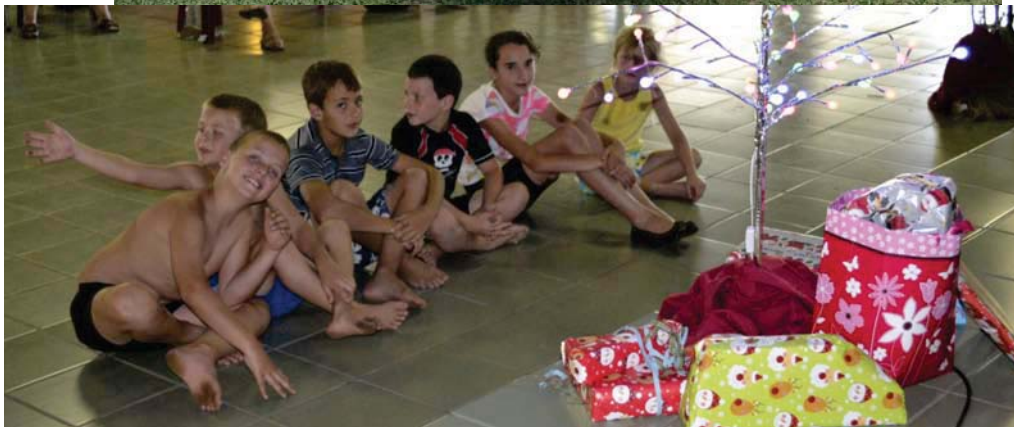
Kersvader word al ingewag.