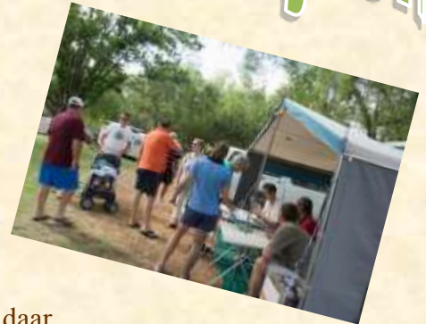
Die Skimkamp se loodjie lyste was ook daar.