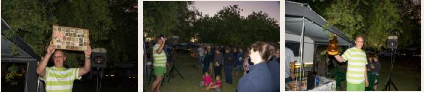
Baie dankie aan almal wat iets geskenk het en ook aan die op wie die bod toe geslaan is.