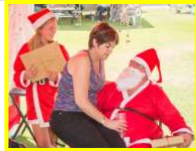
Daar is altyd die kansvatters met Kersvader maar hy het baie skietgoed. Een daarvan is 'n baie duur lipstiffie wat 'n goeie afskrikmiddel is.