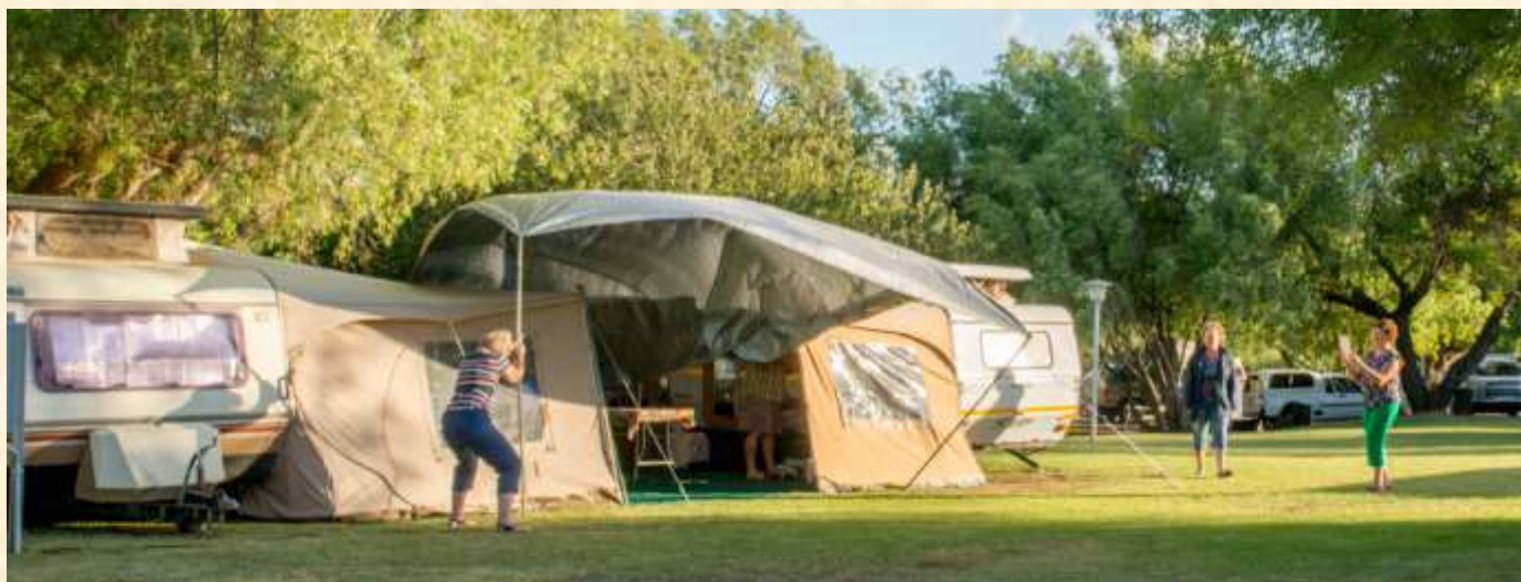
Petro Steyn keer vir 'n vale om die skaduseil te red terwyl daar rustig deur die ander foto's geneem word. Nou hoe nou? Hou poppie hou!