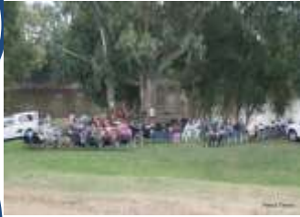
Sawanante kom bymekaar vir die ere-diens

joe, hoe sluit mens so 'n naweek af? Ons was bevoorreg om verskeie gaste van ander streke te ontvang. Daar is nuwe vriendskapsbande gesmee en die drade van die verlede weer opgetel.