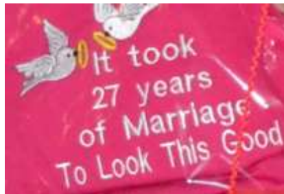
Ons kampmaats het ons verras Met hierdie T-hempde!