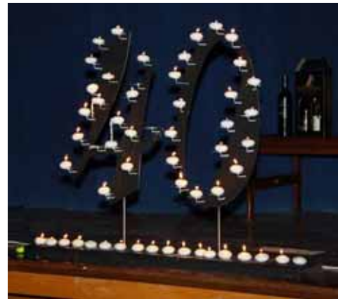
Al die kerse aangesteek—'n regte knop-in-die-keel oomblik.