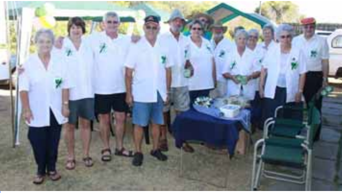
'n Paar van die Loeries was byderhand om hul spoggerige klere vir die oggend te vertoon—Baie mooi.