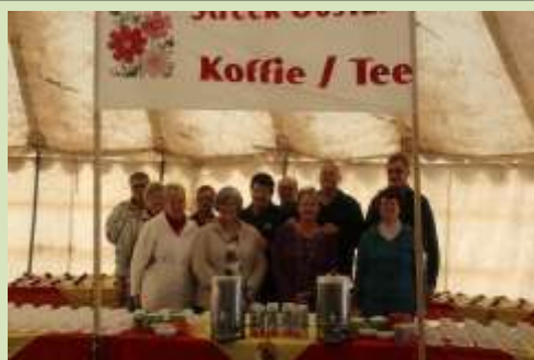
Almal wat gehelp het met die koek en koffie Vrydag oggend na die Kerkdiens