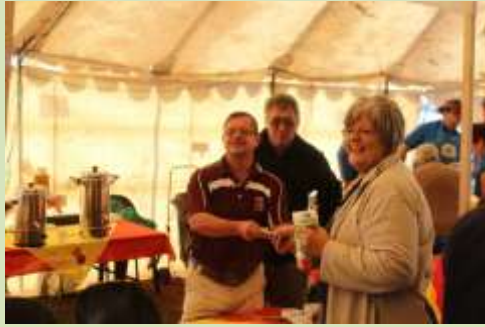
Die koffie en bekers verkoop!