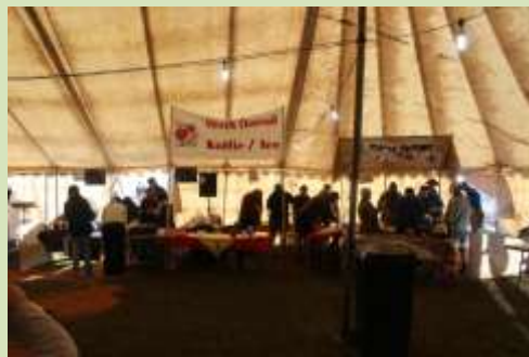
Ons stalletjie met die Kermis