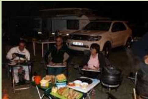
Sit aan vir 'n heerlike potjie