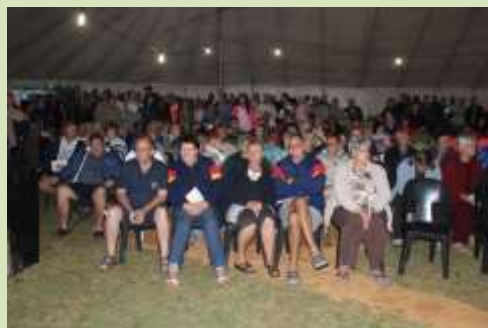
Maak reg vir die Kerkdiens