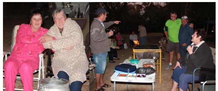
Welkom by die "pajama party"