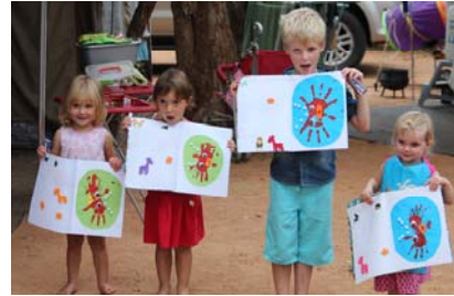
Welpies en hulle kuns. Dankie Ouma Sweetie.