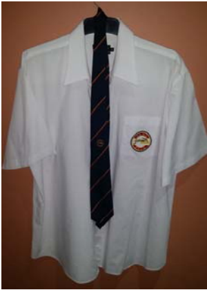
SAWA hemp en das—appart te koop