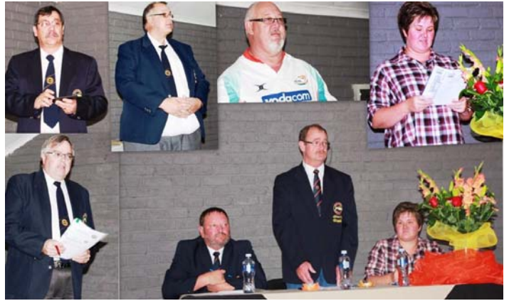
Sjoe maar AJV is 'n ernstige saak!