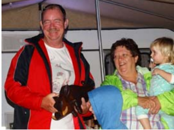
Groot Trofee ontvangers