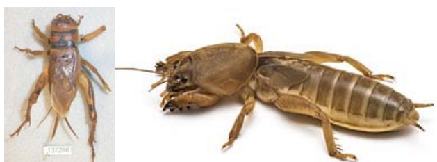
Brachytrupes membranaceus en Gryllotalpa Africana