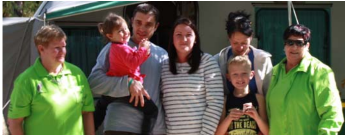
Ons het gaste ook gehad vir die naweek