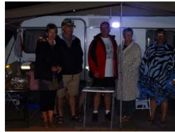
Kampkommandante vir die naweek.