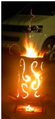
Die kampvuur wat elke aand gemaak is.