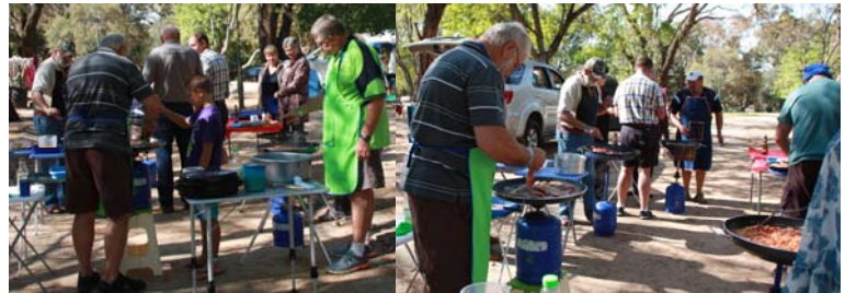
Die straat brunch waarvoor die Luiperds bekend is voor