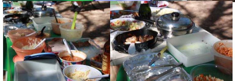
Sondag se koue vleis en slaai tafel. Die Luiperds is weer as "duk" pelle uitmekaar uit.