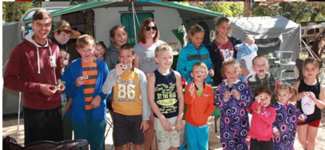
Die Welpies ontvang elkeen hulle Welpie plaatjie en so was hulle elkeen ook beboet deur die varkie "speedcop"