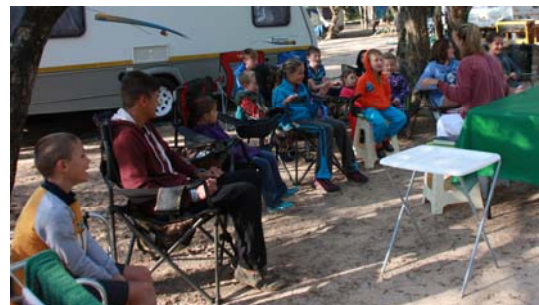
Hier word Sondagskool gehou