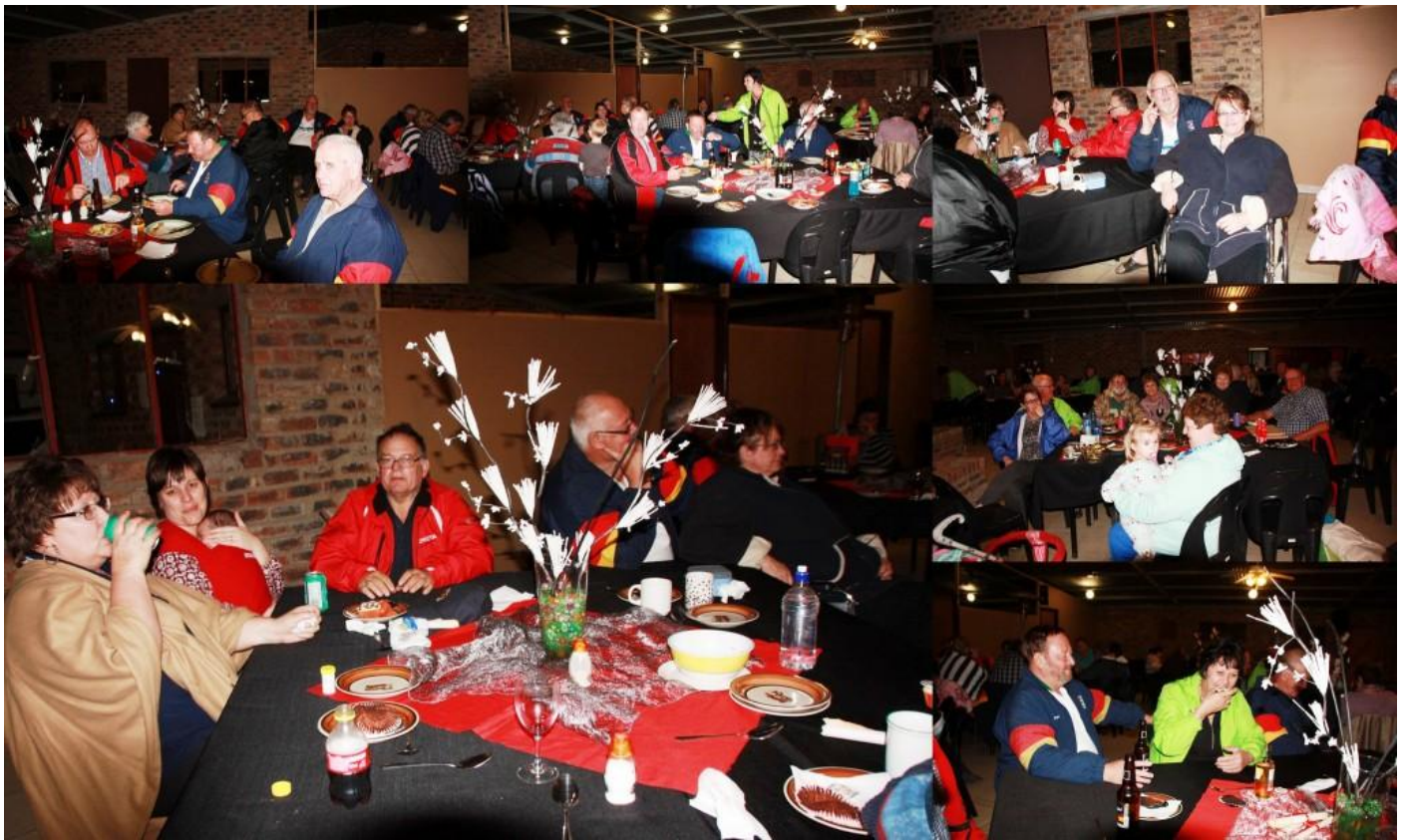
Gelukkig word daar nie net vergadering gehou nie Luiperds kan partytjie hou!!