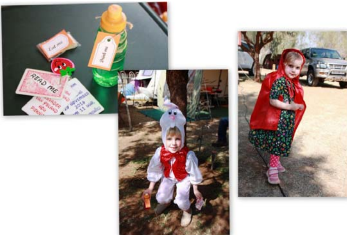
Rooikappie en hasie het vir die kindertjies uitnodigings uit gedeel na hul Alice in Wonderland Kersparty in November