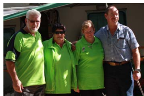
Ons Kampkommandante vir die naweek