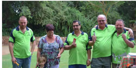
Die verjaarsdag maatjies wat die naweek saam gekamp het