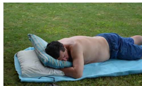
Visvang is hardewerk