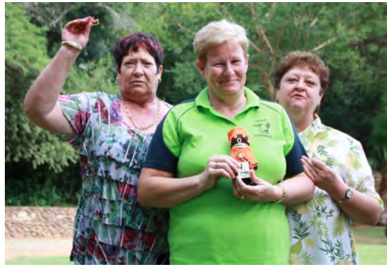
Ons trofee ontvangers