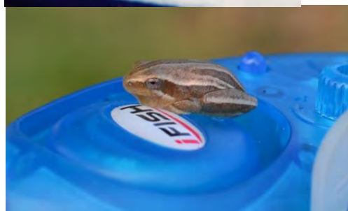
Die oord was vol van die klein paddatjies