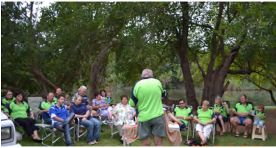
Sondag oggend se afsluiting