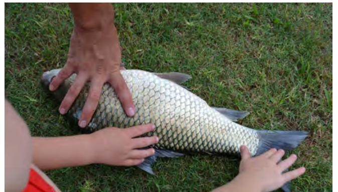
Die rooi oog modderbek vis wat deur JW gevang is