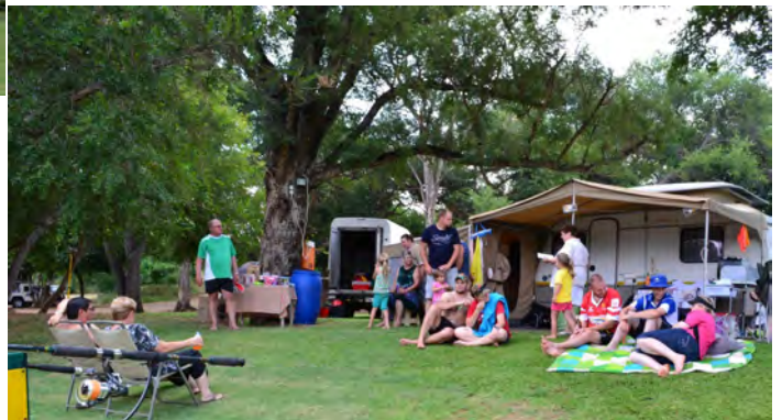
Die prysuitdeling na die visvang kompetisie