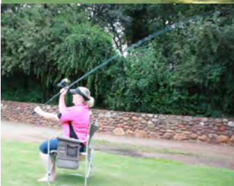
Die groot mense leer visvang terwyl die kinders "marshmallow" visvang