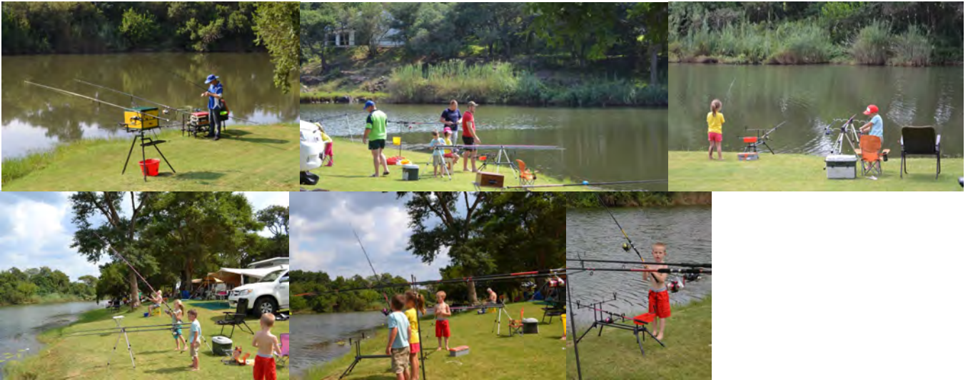
Die visser manne in aksie