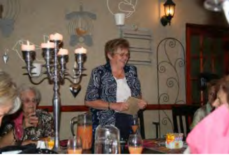
Frieda verwelkom die Senior Burgers