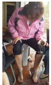
Na 'n harde donderslag - wat het hier gebeur?