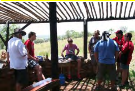
Ons braai 'n worsie bo in die berg