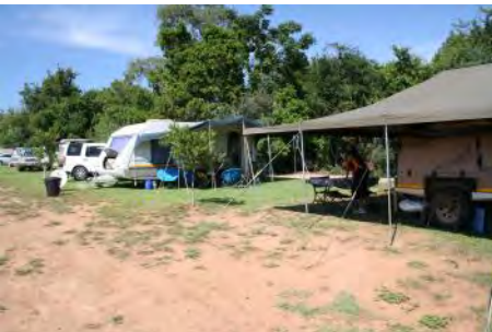
Van die woonwaens by die saamtrek