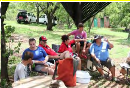
Ons ontspan heerlik voordat die terugtog begin