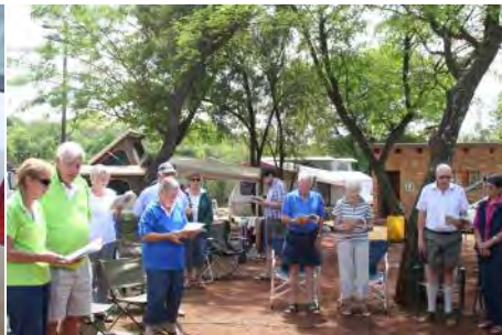
Sondagoggend se erediens