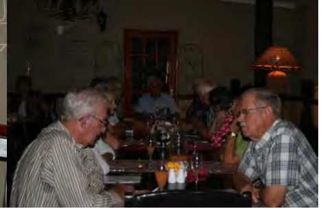
Kiepersol se Senior Burgers kuier gesellig saam