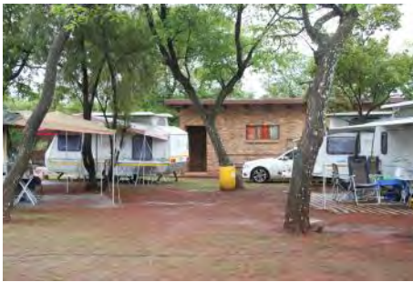
'n Paar van die woonwaens met die netjiese ablusie gebou in die agtergrond