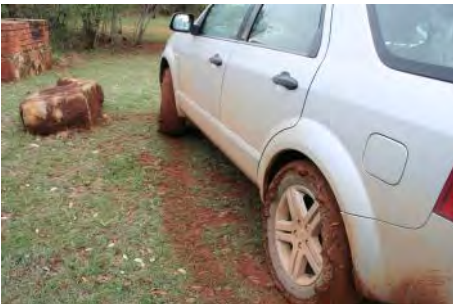
Die vrouens was dorp toe. Kyk die modder aan die wiele