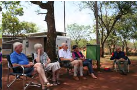
Sondagoggend se erediens