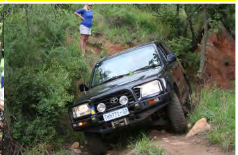
Willem ry versigtig deur een van die hindernisse