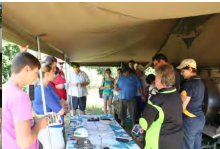
Saterdagoggend—boekvat voordat ons die roete aandurf