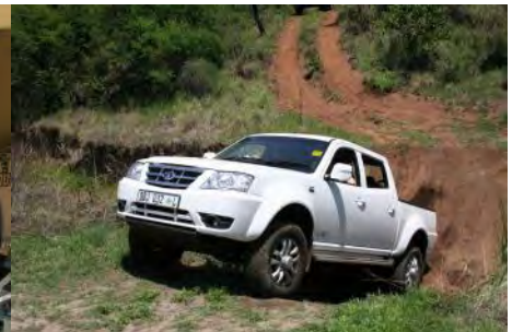
Jaco de Jongh beur deur die eerste hindernis. Dit is ook 'n eerste vir hom met sy eie voertuig