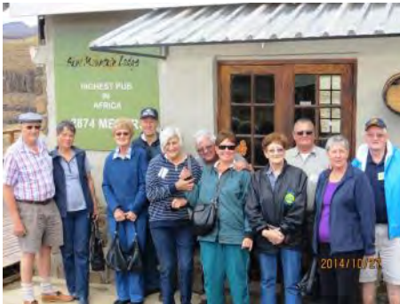
Toergroep op die kruin van Sani pas by die hoogste kroeg-eetplek in Afrika