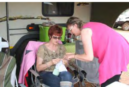
Ons ouma in wording ontvang hekel lesse